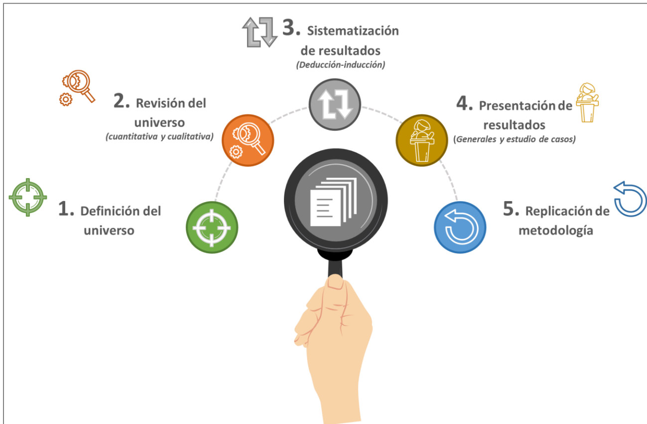
Ilustración 7. Etapas de la metodología para la revisión de expedientes de feminicidios y homicidios dolosos de mujeres.

Dicha revisión se realizará a través de una metodología mixta, con el propósito de obtener el mayor provecho posible de los datos que resulten, y que a través de conclusiones se obtenga un panorama general del estado de los expedientes, las deficiencias que se presentan en su investigación y se definan las diligencias que hacen falta para cumplir con los estándares internacionales de debida diligencia.